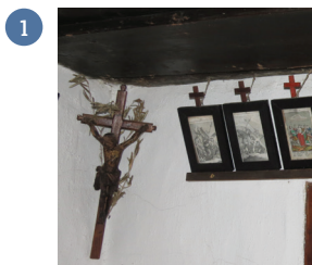
FRANOV POKLIC ...

1 Reši izpolnjevanke. Če boš reševal pravilno, boš na obarvanih kvadratih dobil naslov enega od Finžgarjevih del.