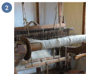
ORODJE ZA TKANJE ...