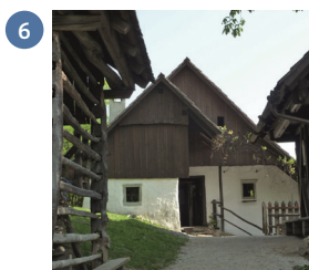
VRSTA HIŠE ...