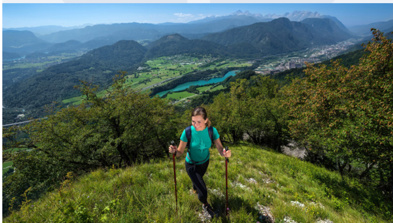
Pogled z Ajdne nad Potoki.